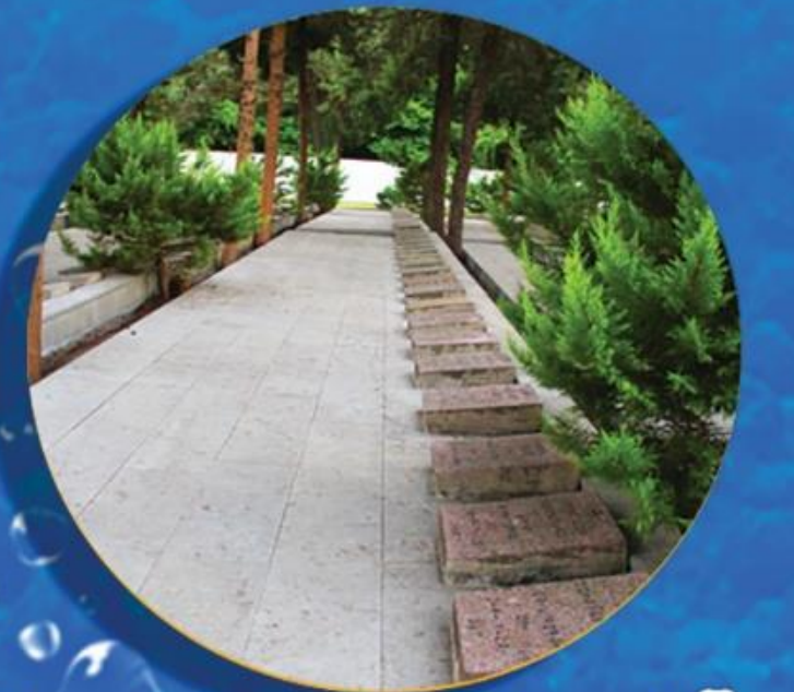
آرامستان لهستانی ها Polish Cemetery