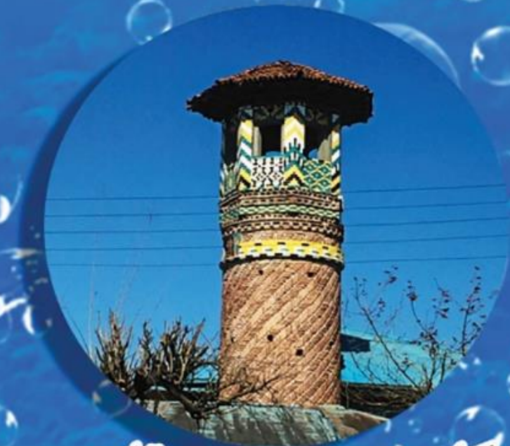
گلدسته مسجد قائمیه Minaret of Ghaemieh Mosque