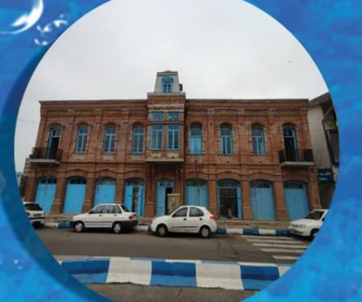
بنای قدیمی بانک ملی Old National Bank Building (Ghandchian)