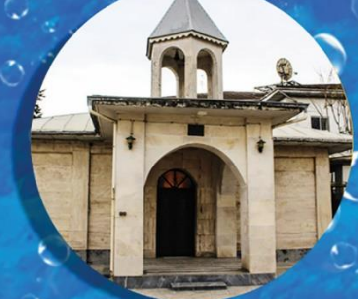
کلیسای مریم مقدس Holy Maryam church