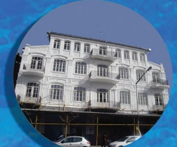
ساختمان قدیمی دادگستری Old Justice Building