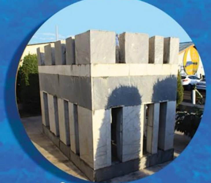
مقبره نائوسروان پیدالله بایندر Tomb of Captain Yadollah Bindor